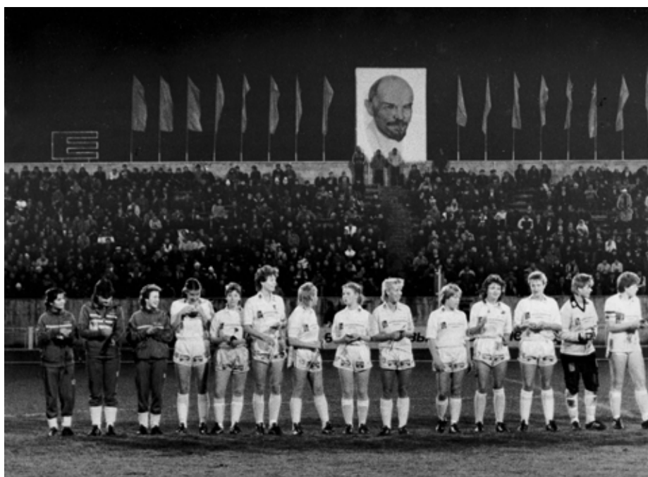
Första damfotbollsmatchen på sovjetisk mark. Alnö möter Vittangi från Norrbotten på Leninstadion i Sotji 1984. Stolt uppställning inför 7 000 åskådare och en övervakande Lenin.

Ett årligt tvådagarsarrangemang där sport och nöje giftes samman till alnöbornas och sundsvallsdits stora uppskattning. I allmänhet arrangerades Idrottens Dag första helgen i juli vid Slädavikens IP. Boxning och brottning fanns ofta på programmet, liksom lokala fotbollsmatcher. Men lika viktigt vara den festliga inramningen. Dans naturligtvis på dansrotundan Hawaii. Gästspel av artister som Truxa och Ulla-Bella Gabrielsson. Mest uppskattad aktivitet var kanske ändå "Gissa vikten på laxen". Dag två fick den hållas vid liv med hjälp av sockerdricka i akvariet, påstår minnesgodaste festdeltagare. Under de femtio år som Idrottens Dag arrangerades var den en av föreningens viktigaste inkomstkällor.