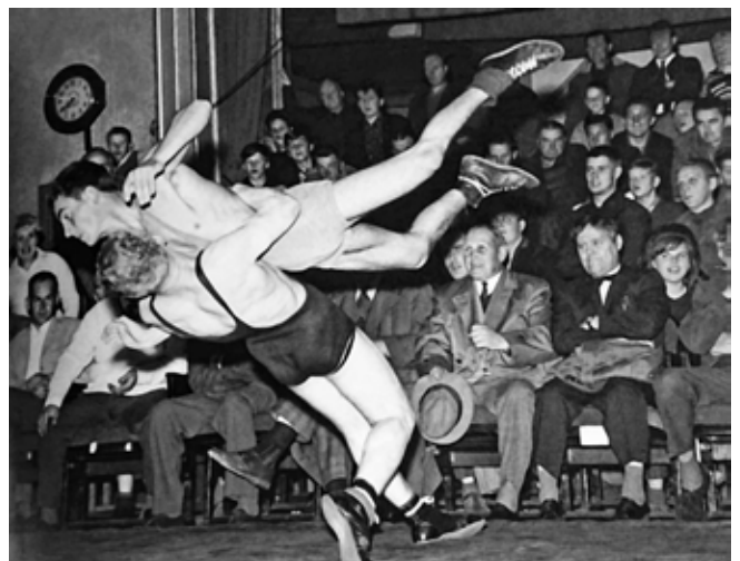
Alnö's brottare tar emot ett lag från dåvarande Jugoslavien inför en fullsatt Karlsvikslokal. Året är 1962.