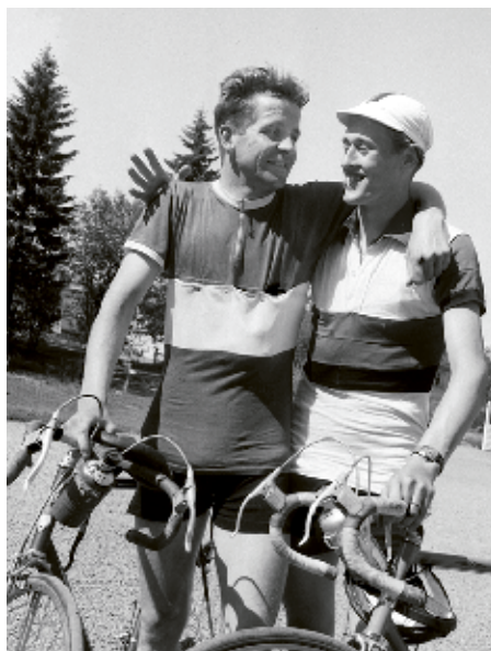
Bubben (t v) – efter segern i Härnösandsloppetets B-klass 1952.