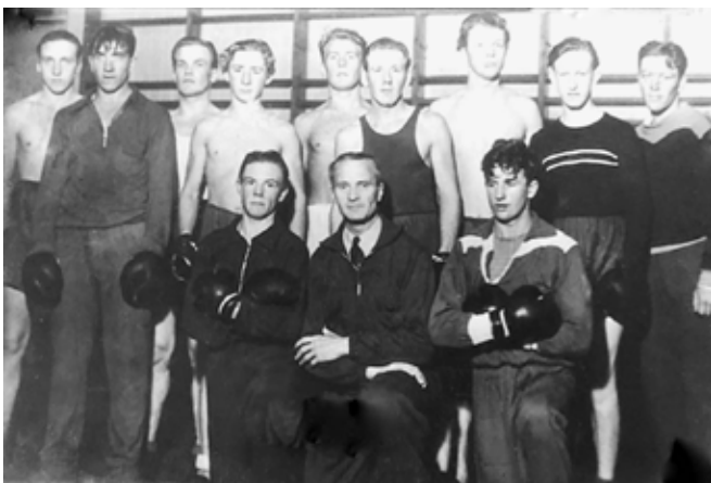
Alnö's boxargarde 1943.

Åtta unga män, de flesta ännu inte fyllda trettio, kom att ta initiativ till föreningens bildande i april 1924. Platsen för bildandet var Hammarstedts café och några dagar senare hölls det första protokollförda styrelsemötet i vestibulen på biografen Palladium.