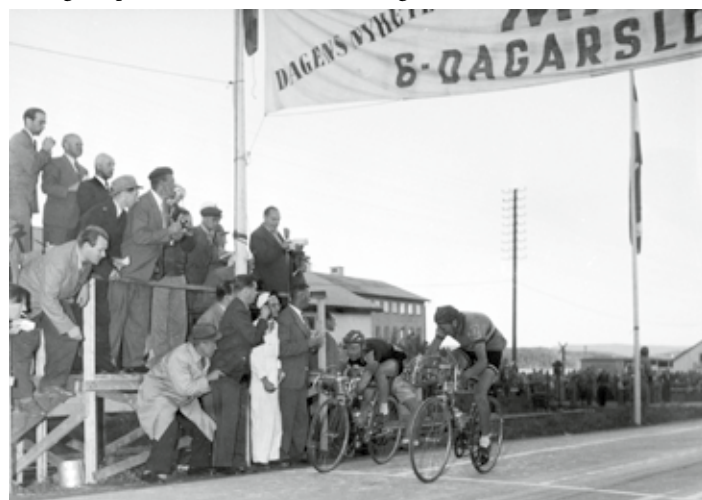
Start i Örnsköldsvik och mål i Kramfors (t h) efter att ha varit nere i Härnösand (t v) – året är 1954 och tävlingen 6-dagars.