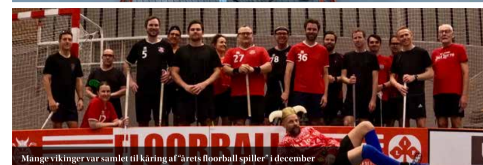
Mange vikinger var samlet til kåring af "årets floorball spiller" i december

bolden, og du får bedre kontakt med gulvet. Det negative er at du belaster ryggen mere, og dette kan føles ukomfortabelt. En længere stav vil give dig længere rækkevidde, men det bliver vanskeligere at kontrollere bolden.