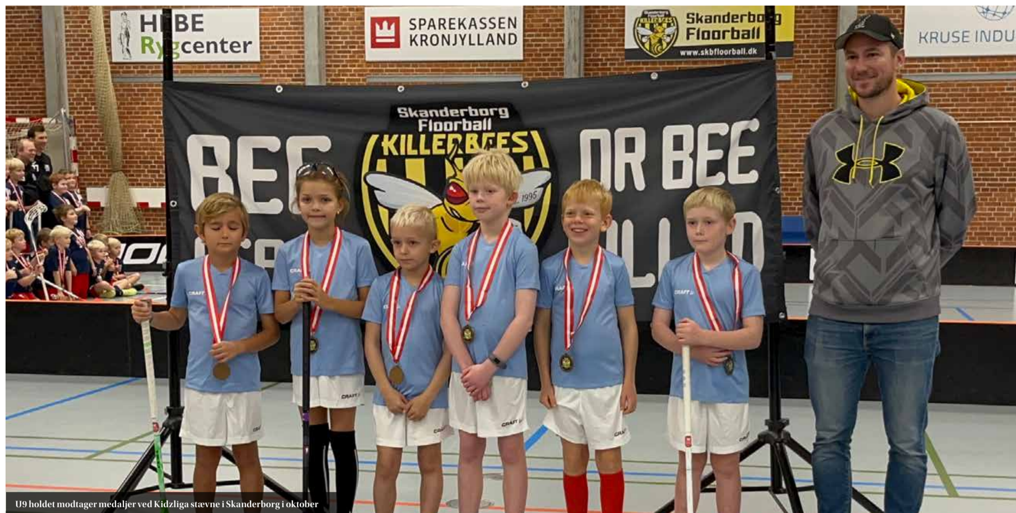
U9 holdet modtager medaljer ved Kidzliga stævne i Skanderborg i oktober